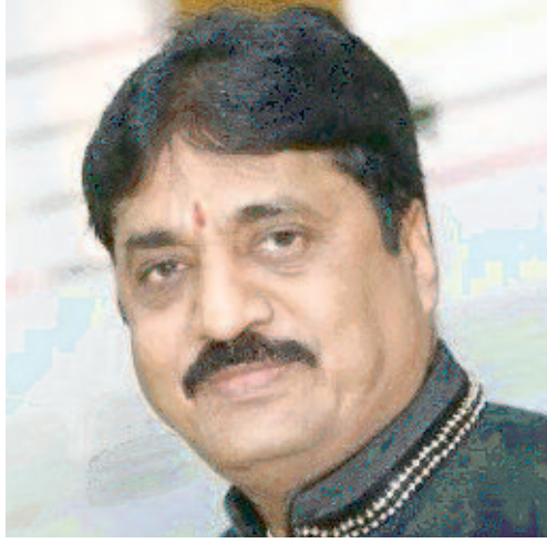
हिन्द आत्मा संवाददाता